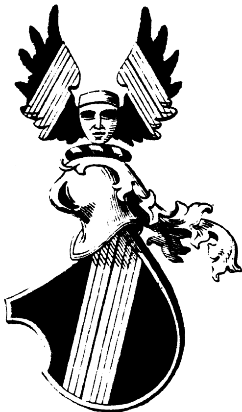
Wappen der Familie von Heggen nach A. Fahne, Autor des Buches: "Geschichte der Westf. Geschlechter".