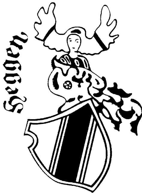
Das Heggener Wappen

Wer kennt es nicht, das Heggener Wappen. Es schmückt die Schützenfahnen und die Uniformen der örtlichen Vereine. Viele Heggener haben das Wappen als Aufkleber an ihrem Auto und bringen damit die Verbundenheit mit ihrer Heimat zum Ausdruck.