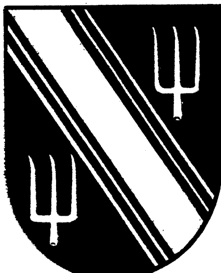
Wappen der Gemeinde Attendorn-Land

Auf schwarzem Grund ein silberner, beidseits von zwei silbernen Fäden begleiteter Schrägbalken, zu beiden Seiten befindet sich je eine silberne, dreizinkige Gabel.